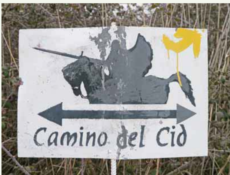
El Cid ontmoet Santiago.

De vierde dag bereiken we Santo Domingo de Silos. Vanuit onze hotelkamer kijken we uit op het klooster. Het is licht beginnen te sneeuwen. We bezoeken de kloostergalerij, hoogtepunt van de romaanse bouwkunst in Spanje. In de ontvangsthall hangt de platina plaat die de monniken ontvingen toen ze in 1995 meer dan honderdduizend cd's verkochten van hun gregoriaanse gezangen. Ook in ons land drongen de monniken door tot de hitparade. 's Avonds en de volgende ochtend gaan we naar de mis. De kerk is vol dagjesmensen en de monniken zingen prachtig gregoriaans. Het landschap wordt leger. Elke dag komen we wel herten tegen, en een enkel keer een everzwijn of een vos. Direct na Huerta del Rey cirkelen wel veertig vale gieren direct boven ons rond een heuveltop. We komen in de provincie Soria, de streek die het sterkst ontvolkt is in Spanje. In de dorpjes wonen nog maar een paar achtergebleven ouderen en enkele