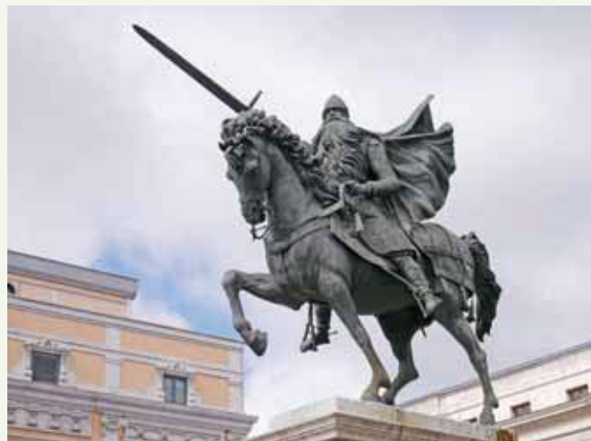
El Cid in Burgos.

nen verenigen in de strijd voor politieke en religieuze onafhankelijkheid van de Moren. Vanaf de zestiende eeuw ontstaat de figuur van Santiago Matamoros, de morendoder. Santiago wordt afgebeeld als krijger te paard met opgeheven zwaard. Onder de voeten van het paard liggen dode en gewonde personen. In het Poema de Mio Cid wordt El Cid uitgebeeld als een liefhebbende echtgenoot en vader, genereus voor zijn vrienden, een heldhaftige soldaat, een onoverwinnelijke veroveraar, grootmoedig voor de verslagenen, trouw aan zijn land en aan de koning, vertrouwend op God. In werkelijkheid was hij echter een huurling die zowel voor Moorse prinsen als christelijke koningen vocht. In talrijke legendes over Santiago en El Cid laten de christelijke Spanjaarden zien dat God aan hun kant staat. Zowel Santiago als El Cid verschijnen op het strijdtoneel om de christenen in hachelijke situaties aan de overwinning te helpen. Ondanks hun verschillen worden ze steeds meer met elkaar geïdentificeerd. Hun iconografie gaat op elkaar lijken door het gebruik van vier