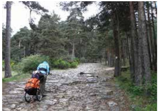
De Romeinse weg naar Puerta de Fuenfria.

Ieder voor zich zwoegen we ons naar boven en elke keer als ik denk dat we de wheelies beter kunnen gaan dragen, zie ik een ogenschijnlijk beter stukje voor ons. En elke keer blijkt dit een illusie. Twee oude Spaanse mannen met wandelstokken lopen ons voorbij. De man met een blauw alpinopetje op, een grote grijze snor en een dikke sigaar in zijn mond, blijft